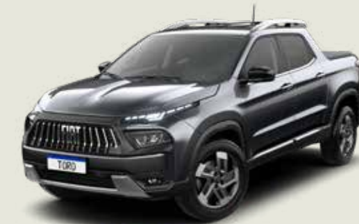
847 - Gris Granito