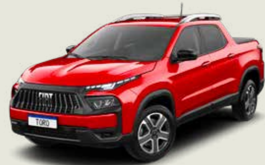
176 - Rojo Tribal