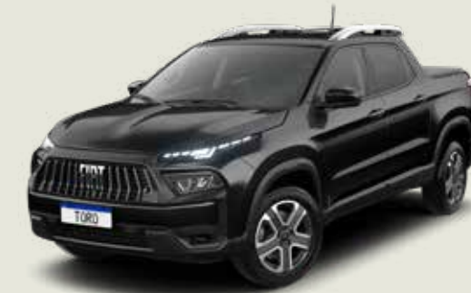
852 - Negro Carbono