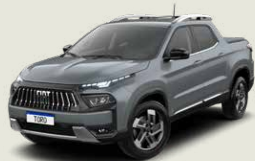
503 - Gris Sting