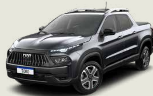
847 - Gris Granito