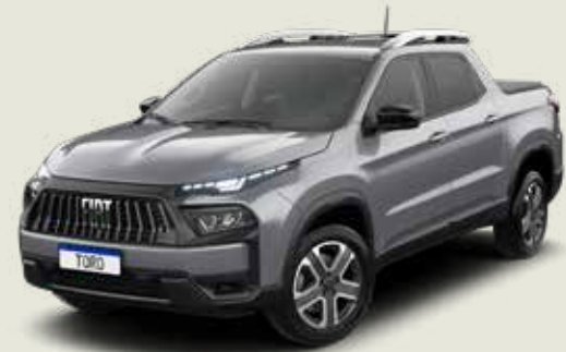
097 - Billet Silver