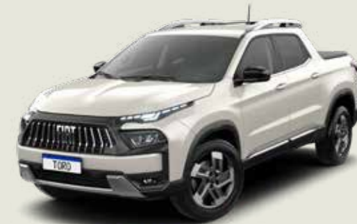
742 - Blanco Polar