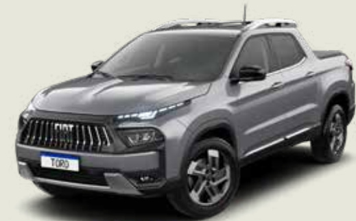
097 - Billet Silver