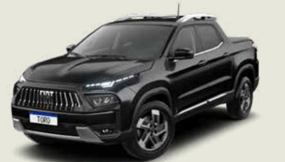
852 - Negro Carbono