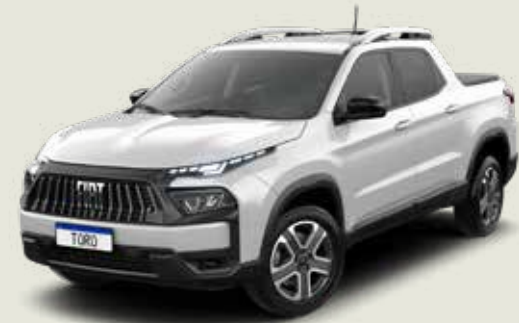
296 - Blanco Ambiente