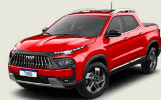
176 - Rojo Tribal