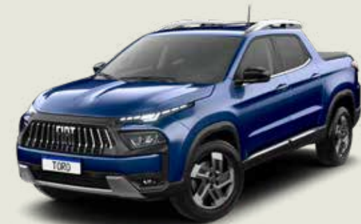
345 - Azul Jazz